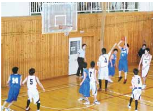
東信定通体育大会